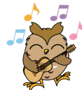
瀬谷区マスコットキャラクター せやまる