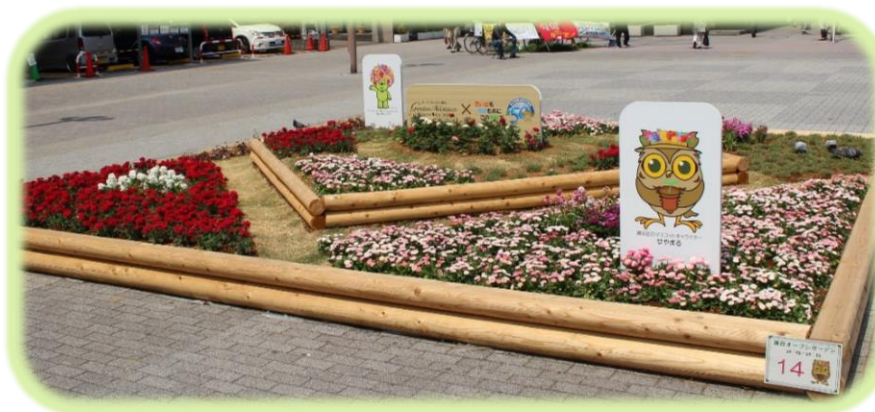
春の大花壇設置の様子

※日頃から瀬谷区の緑化推進に御協力いただいているボランティアの皆さんも、参加されます。