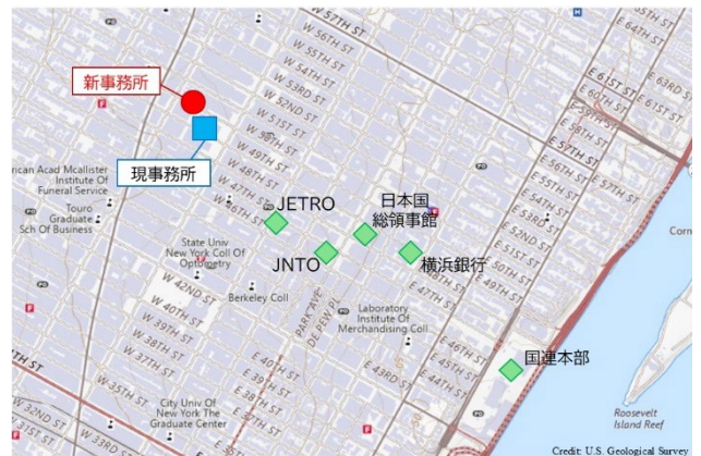
ニューヨーク市ミッドタウン区域

現住所：4月17日（金）まで業務 ※4月18日（土）・19日（日）は閉所 1251 Avenue of the Americas New York, NY 10020, USA