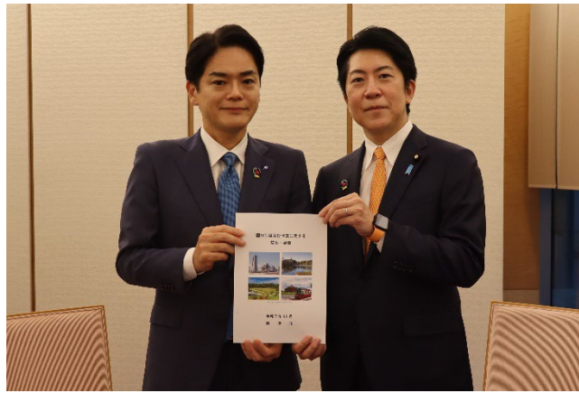
<横浜市「国の制度及び予算に関する提案・要望」>