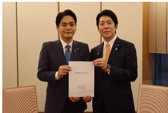
＜地方分権改革の実現に向けた要求について＞