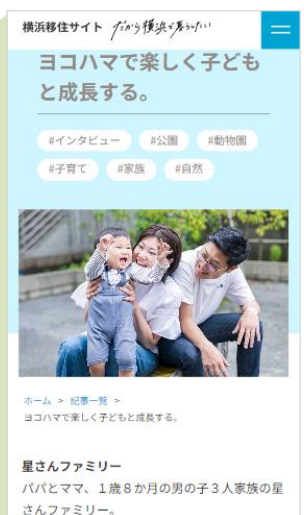
▲生活者インタビュー