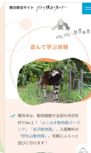
▲「子育て・教育」コンテンツ