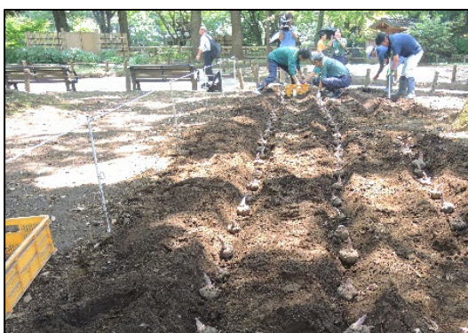
令和元年度の植付けの様子