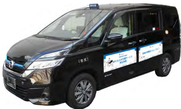
（参考：運行車両のイメージ）