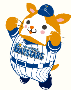
横浜DeNAベイスターズ マスコット DB, スターマン

ヒントを基に新たな家事シェアチャレンジを考えてみよう！ 「これがしたい！」という理想があると、 アイデアもより具体的に！