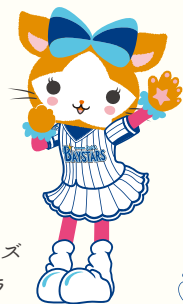
横浜DeNAベイスターズ マスコット DB, キラ