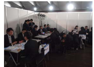
H30 年度のセミナーの様子

内容：海洋分野の仕事について理解を深めるため、大学生・大学院生 を対象に企業・団体からの業務紹介と個別相談会を実施します。