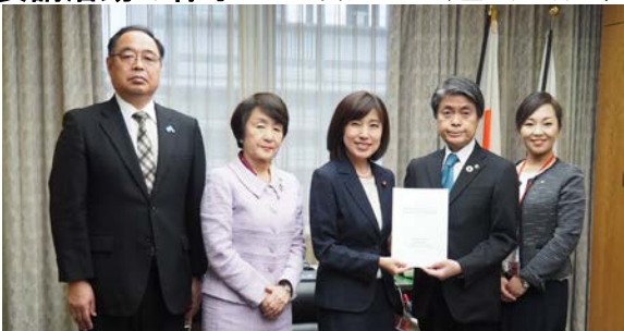
※木村総務大臣政務官（左から3人目）、林市長（左から2人目）