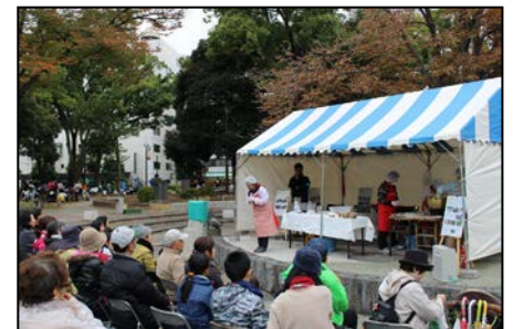
こんにゃく作り見学