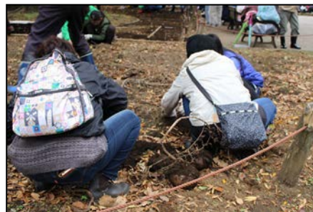
こんにゃく芋掘り体験