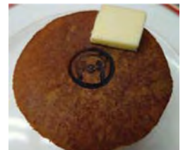
コラボメニュー例 (焼き印入りホットケーキ)