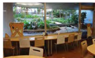
店内もタッチーくん仕様に！