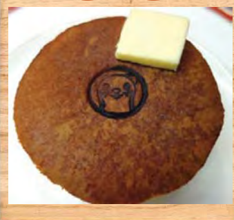
タッチーくん印のホットケーキ (メニュー例)