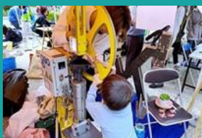
プラスチックのマテリアルリサイクルワークショップ