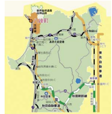
八峰町の位置

発電事業者 ウェンティ・パル八峰合同会社 場所 秋田県山本郡八峰町峰浜目名瀬字大沼 発電出力 2基最大4,890kW（4.89MW）一般家庭4,000世帯相当