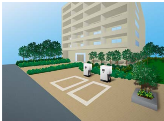
【集合住宅の充電器設置イメージ】

横浜市は、e-Mobility Power と連携し、 集合住宅や国内では設置事例のない場所への設置支援(新基準策定や規制緩和等) に取り組みます。具体的な内容は決定次第お知らせいたします。