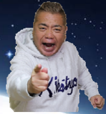
おうち de 省エネのキャンペーンボーイ 出川 哲朗 さん