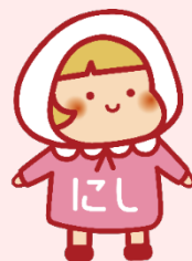
横浜市地域福祉保健計画 西区版キャラクター 「ちふくちゃん」