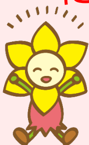
西区のマスコットキャラクター 「にしまろちゃん」