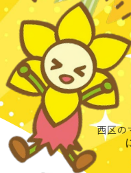
西区のマスコットキャラクター にしまろちゃん