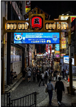
フライデーナイト FrameCatcher 様 横浜駅西口五番街商店会 協同組合