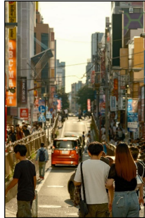
横浜西の日常 サカナリクト 様 西口幸栄商店会