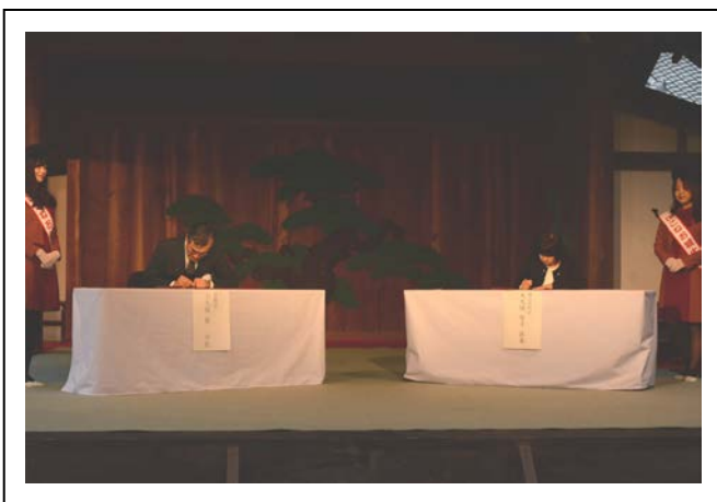
（左）彦根市 大久保市長 （右）西区 大久保区長