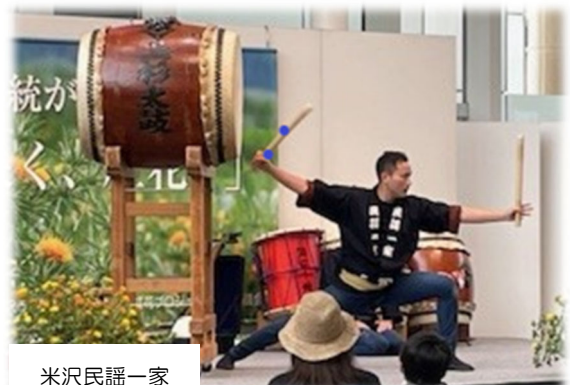
令和 6 年度オープニングセレモニーの様子