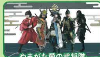
やまがた愛の武将隊