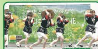
山形大学花笠サークル四面楚歌