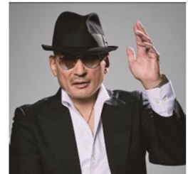
中区って「イイネ！」フォトコンテスト2024 特別サポーター 横山剣 氏 （クレイジーケンバンド）