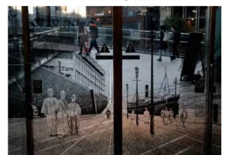
2023年度 一般部門金賞