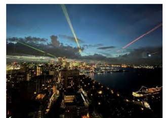
2023年度 中高生部門金賞