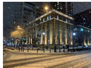
2022年度 一般部門金賞 《雪の中区役所別館》