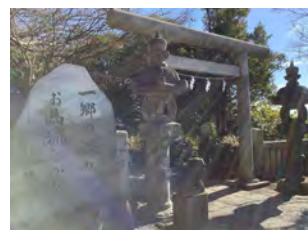
2022年度 小中学生部門金賞 《本牧の光の入り口》