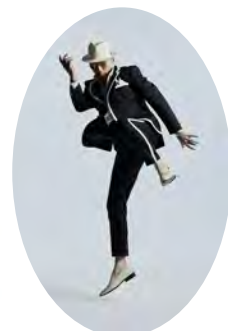
特別サポーター 横山剣 (クレイジーケンバンド)