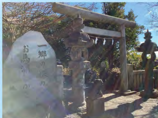
掲載されている写真は、2022年度の応募作品です。