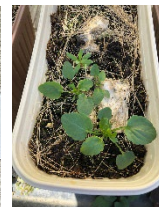
左： シードペーパー