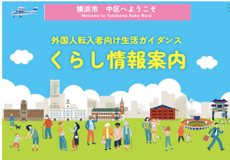
「くらし情報案内」Web サイト

中区では、主に新規転入した外国人を対象に、日本で生活する上で必要となる様々な情報を提供する「くらし情報案内」を令和5年2月15日から開始します。令和4年度は日本語、英語、中国語の3言語で開始し、令和5年度以降は言語を追加していく予定です。