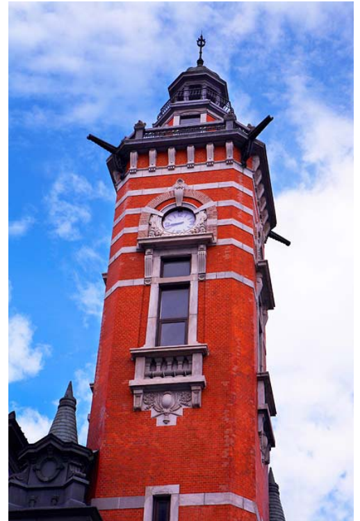
普段は非公開のジャックの塔（時計塔）