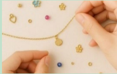
◀ ワークショップ (イメージ)