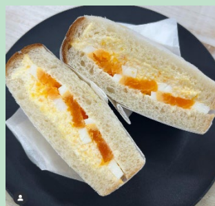
▲新鮮たまごサンド 【ジョブプリコ】