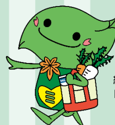
緑区キャラクター 「ミドリン」

GREEN×EXPO 2027 の期待感・高揚感の醸成や、地産地消・脱炭素の推進等を目的として、今年も JA 横浜共催のマルシェイベントを開催します。