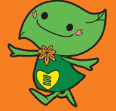
緑区キャラクター「ミドリン」

緑区内では、オレオレ詐欺をはじめとする“特殊詐欺”が多く発生しています。 特殊詐欺被害撲滅のため、緑区防犯ポスターコンクール（緑防犯協会主催）で、区内の小学生から応募のあった作品（497点）のうち、「緑区长賞」を受賞した作品を市営バスにパートラッピングし、特殊詐欺防止を呼びかけます。