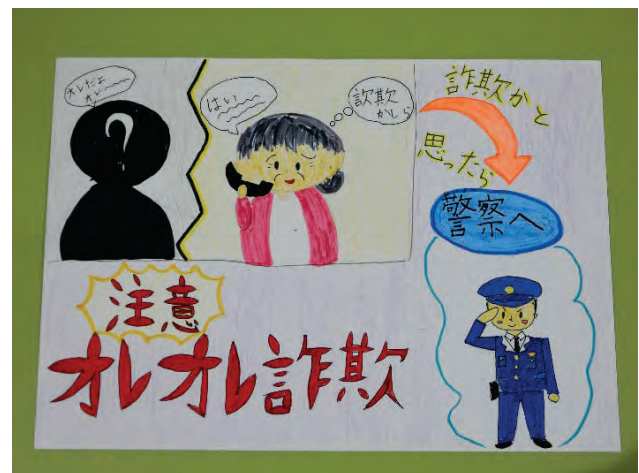
<緑区长賞受賞作品（小学5年生）>