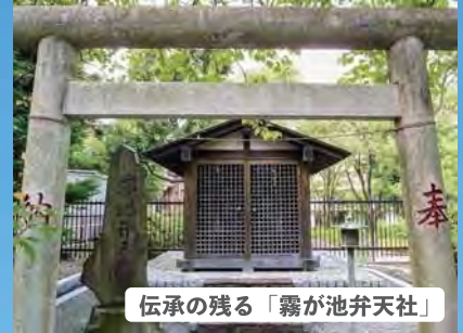
伝承の残る「霧が池弁天社」

地域 の方がよく知っているものより、地域の歴史や伝承に基づいたもので「なんで？」と人々に思わせるデザインにすることで、わらアート作品を通して人々が地域の歴史や伝統について語り合い、改めて地域の事を知りきっかけづくりとして、わらアート作品を制作します。緑区の伝承の中から「霧が池の伝説」、「霧が池の大蛇の伝説」に基づき「龍」、「亀」、「馬」の関連性のある3作品を制作し、作品に物語性を持たせることで、より記憶に残るものにします。