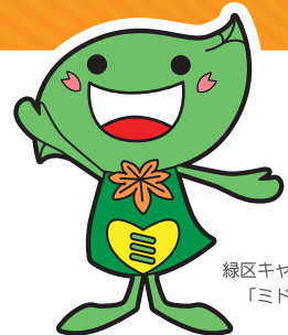
緑区キャラクター 「ミドリリン」

日時 令和元年 11 / 23 土 24 日 30 土 12 / 1 日 9:00 ~ 16:00 ※ 荒天中止