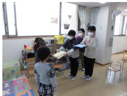
保育園を訪問し園児に本をプレゼント