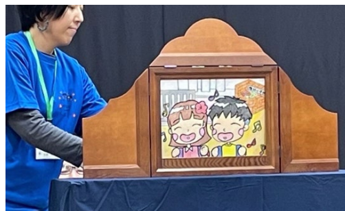
「梅林ものがたり」実演