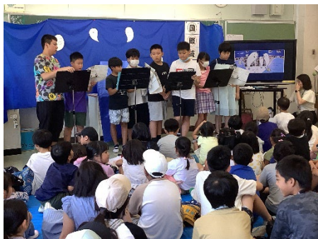
国際読書会で活躍する図書委員児童