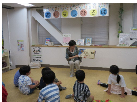
ひろばのどんぐりおはなし会