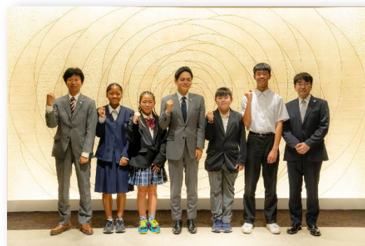
令和6年度の市長訪問の様子 ▲

※ 取材いただける報道機関の方は、令和7年12月16日(火)午後5時までに下記お問合せ先にご連絡の上、当日会場に直接お越しください。なお、取材・撮影等に当たっては現地担当者の指示に従っていただきますよう、お願いします。