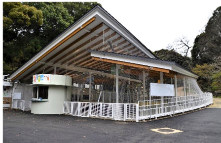
なかよし広場(屋根設置)