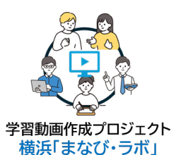
学習動画作成プロジェクト 横浜「まなび・ラボ」

今回は、とくに子どもの興味を引き出す工夫に挑戦した5校を表彰します。子どもの「主体的な学び」を後押しする新たな枠組みが動き始めています。