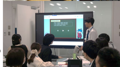
「学びのきっかけ」動画 開発の様子