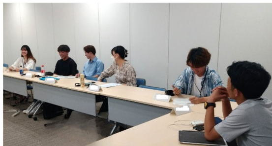
実行委員会活動の様子

「コロナの影響で、私たちは、かつて描いた理想とは大きく違う青春時代を過ごしてきたが、何も見えない暗闇の中で、自分自身、そしてともに歩く仲間の足音を道しるべに歩んできた。これまでの努力の証、これからの人生の糧として、私たちの足音が輝くことを信じたい」という想いを込めて、 二十歳の市民を祝うつどい実行委員会がテーマを決定しました。