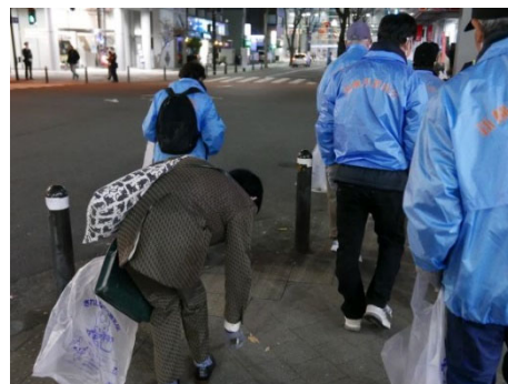
清掃活動の様子（昨年度）