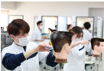
授業風景 【理容科】カット

※混雑した場合には、新型コロナウイルス感染症予防のため、体験をお断りする場合があります。