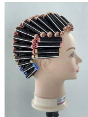
ワインディング・アップ