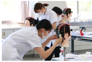
授業風景 【美容科】ワインディング