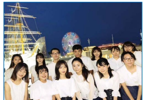
令和4年横浜市「成人の日」記念行事実行委員会

今年のテーマは「人生100年時代—AM4:48—」です。横浜市「成人の日」記念行事実行委員会（以下、「実行委員会」）が「人生100年時代において、100年間を1日（24時間）に換算すると、20歳は午前4時48分であり、夜明け前である。まだまだ時間はたくさんあり、可能性は無限であるから、何事にも挑戦しよう」という想いを込めて、決定しました。