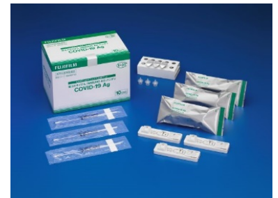
配布用抗原検査キット

検査キットで、前日または当日朝に、御自身で検査し陰性を確認してから御来場いただくことを勧奨するため、 市内在住の全新成人あてに通知を発送 しています（発送日：12月21日（火））。