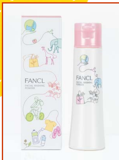
↑最終的に決定したデザイン

作成する際に工夫した点は、私たち取材してもらえるように、メッセージを載せたことです。