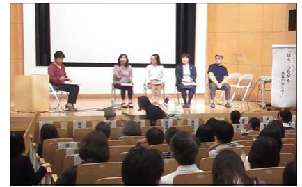
昨年度のイベントの様子