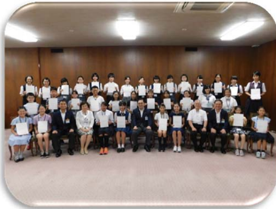
ピースメッセンジャー・子ども実行委員 委嘱式の様子