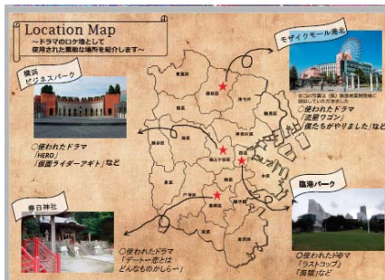
企画ページ「ロケーションマップ」 （Microsoft Wordで作成）