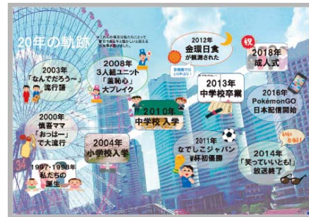
企画ページ「20年の軌跡」 （パワーポイントで作成）