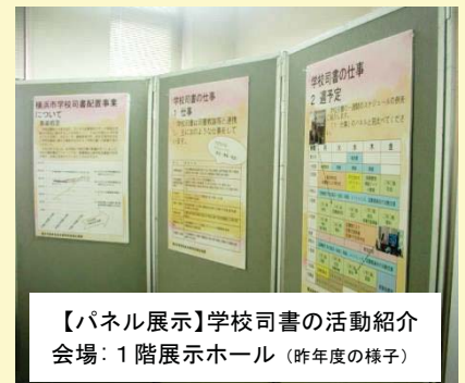
【パネル展示】学校司書の活動紹介 会場: 1階展示ホール (昨年度の様子)