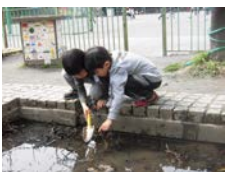
「こういたんけん （なかよしタイム）」

この時期の発達特性をふまえ、 生活の中の興味・関心を核とし活動や体験を中心とした学習 を取り入れたり、新しい集団の中での人間関係を徐々に築いていけるようにしたりしていきます。