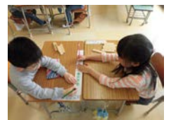
「いくつかな （ぐんぐんタイム）」

※取組に関する問合せや当日の取材については、事前に本郷台小学校にご連絡ください。