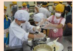
「大豆のみりよく大発見！」 （総合的な学習の時間）」

場所 横浜市立本郷台小学校（栄区本郷台1-6-1） 根岸線「本郷台」駅下車 徒歩10分