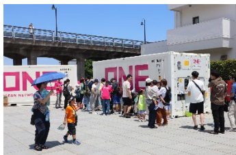
冷凍コンテナの見学

<サイドイベント（歩行領域モビリティ体験）試乗会>（16歳以上） 電動で歩道を走れるモビリティを体験できます。 横浜市役所北プラザ及び周辺の公道で試乗体験を実施します。