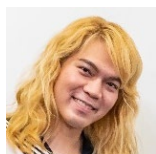
まづき 鈴木 かりん※2 番魚武