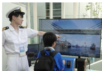
船の操船シミュレーター

船の VR 操縦体験や、海の生き物を学べる展示、海の仕事体験など、楽しく学べるコンテンツが盛りだくさんです。