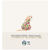
< アロハ縫茅ヶ崎 >

熱中症対策の決定版！「おまもりクロス」をはじめ、新作もご用意。ノベルティのオシャレなうちわも必見です。