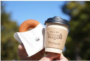
< WEEKEND >

「海から届く、季節のごちそう。」をコンセプトに鮮度の良い魚だけを選び、素材の魅力を活かして仕上げました。