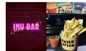
< INU BAR >

ワンコと一緒に楽しめる“焼き芋スイーツ”と、山形果実を使った飲むかき氷がオススメ！