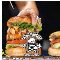
< Yasuda Burger >

横浜の人間と犬の休憩所。自家焙煎スペシャルティコーヒーをはじめとしたドリンクもスイーツも全て手作りです。