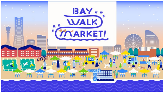
＜イベントキービジュアル＞