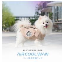
< グルル -ペット専用空調ウェア- >

オシッコやうちの汚れ、ペット臭の消臭に。洗剤・化学合成物質不使用のペット用お掃除スプレーです。