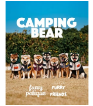
< Furry Friends >

アウトドア風のデザインが特徴の、香港発のペットアパレルブランド「CAMPING BEAR」を販売。