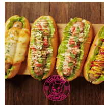
< ブラジリアン・フードトラック バハカオン >

豪快かつ美しく焼き上げる圧倒的な旨さ！行列必至のセンスが光る、湘南・西湘地域発のハンバーガー店。