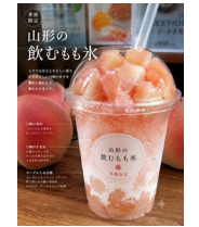
< やきいも処DOCO式番館 >

ブラジルソーセージのホットドッグをはじめとしたブラジル料理を提供する、横浜のフードトラックです！