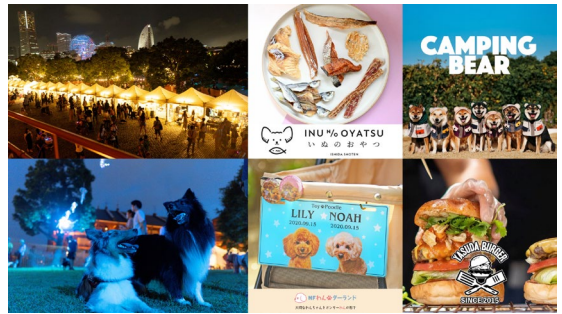
＜過去開催時の様子・販売グッズ・フードイメージ＞

横浜みなとみらい新港地区の臨海部に面する横浜赤レンガ倉庫、MARINE & WALK YOKOHAMA、横浜ハンマーヘッド、DREAM DOOR YOKOHAMA HAMMERHEADの4施設を結ぶ水際線プロムナードで、2026年7月18日（土）から20日（月・祝）の計3日間、今回で13回目となる『BAY WALK MARKET 2026』を開催します。海沿いの開放的な空間でお散歩しながら楽しめるマーケットとして、2026年3月開催時は約24万人のお客様にご来場いただきました。