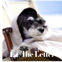
< The Letter >

サマーシールドのバギーカバーやケープ、ヴィンテージシルクの一点物ネックローを販売。