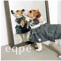
< eqpé >

みなとみらいエリアをワンちゃんですり抜けしたナイトイベント「犬夜市～イヌヨイチ～」を今年も開催！横浜赤レンガ倉庫エリアでは、約100店舗が前ラナイトドッグマーケットを展開。夜はイルミネーションが灯り、お祭りのような空間をワンちゃんと楽しむことができます。さらに今回は、ワンちゃんと一緒にお酒を楽しめる「INU BAR」が初登場！ワンちゃんと一緒に、夜のひとときをお楽しみください。