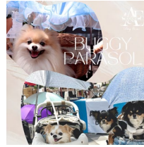
< ANGE >

愛犬に快適な夏をコンセプトに、犬用空調ウェアを販売。涼しさ体験やご試着も可能です！