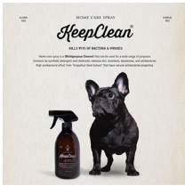
< KeepClean >

アウトドア風のデザインが特徴の、香港発のペットアパレルブランド「CAMPING BEAR」を販売。