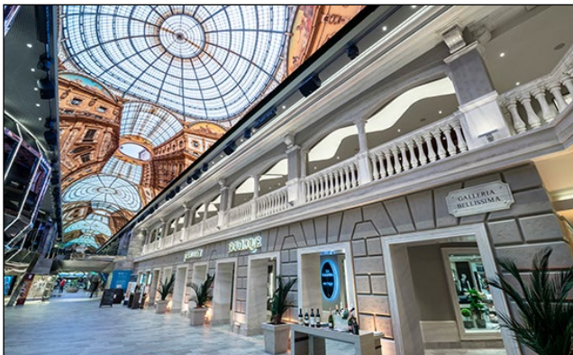
全長90mのプロムナードのドーム型LEDスクリーンの天井