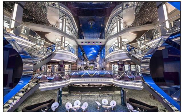
スワロフスキー社のクリスタルが敷かれた階段