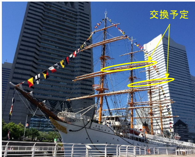
交換を予定しているヤード（2か所）

今後は多くの方々の想いが詰まったこの帆船日本丸の航跡を末永く未来へつなぐため、集まった寄附金を船体維持修繕（木製ヤード交換工事の一部）や無線日誌の修復、日誌を長期保存する専用箱の作成などに大切に活用させていただきます。多くの御支援をいただき、本当にありがとうございました。