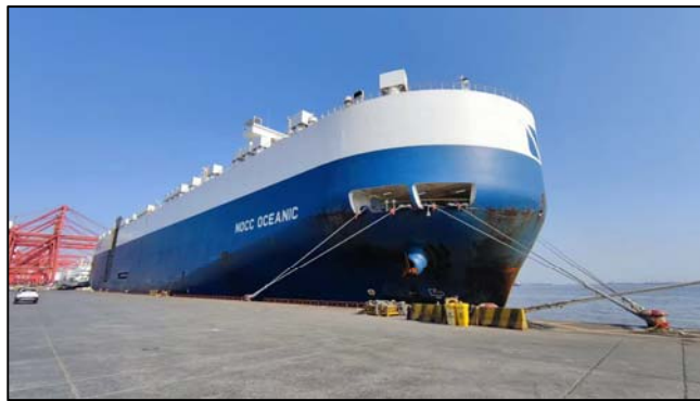
【NOCC OCEANIC】

横浜市並びに指定管理者の横浜港埠頭株式会社では、令和4年5月1日（日）に新規航路へ投入された本船が入港したことを記念して、歓迎訪船と記念品の贈呈を行いました。