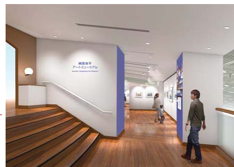
【柳原良平アートミュージアム イメージ図】

※帆船日本丸との共通券があります。詳細はHPでご確認ください。(http://www.nippon-maru.or.jp/)