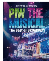
オリジナルステッカー