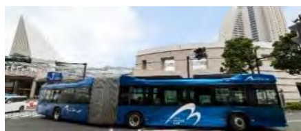
▲ベイサイドブルー ▼あかいくつ